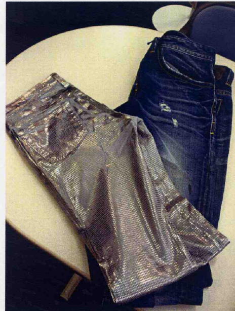
個性派からベーシックジーンズまで「テンセル」の実績が高まる

レンチングは2014年末にテンセルの増産を予定しているが、重点拡大分野の一つにジーンズが挙げられる。このため5月に東京で開催を予定する「レンチング・イノベーション」展でもデニムをテーマにした様々なセミナーなどを計画しており、引き続きジーンズ用途でのテンセルの魅力発信を強化する。